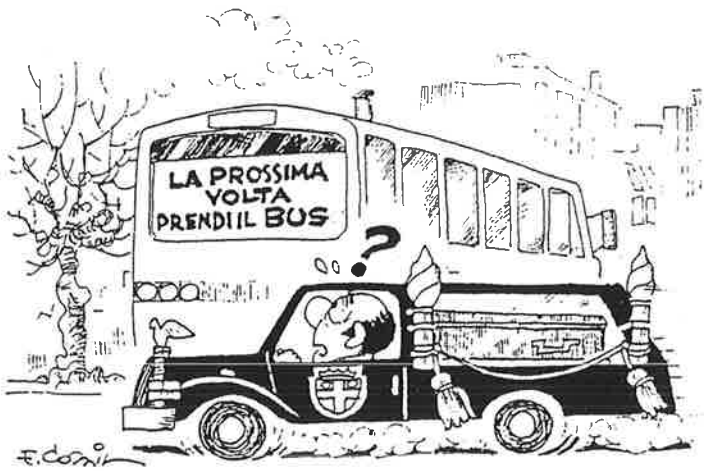
Gennaio '90 Campagna per incentivare l'uso dei mezzi pubblici urbani