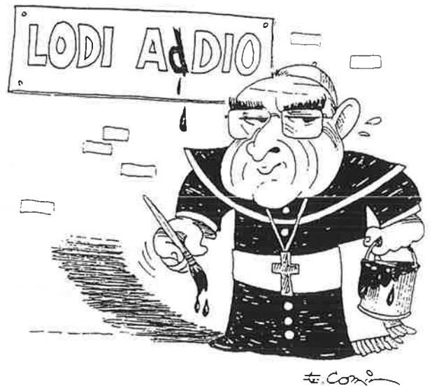
Febbraio '90 - Arriva da Lodi il vescovo Magnani