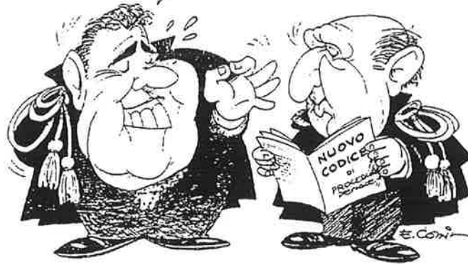
Ottobre '89 - Il nuovo Tribunale apre in concomitanza con l'approvazione del nuovo codice di procedura penale