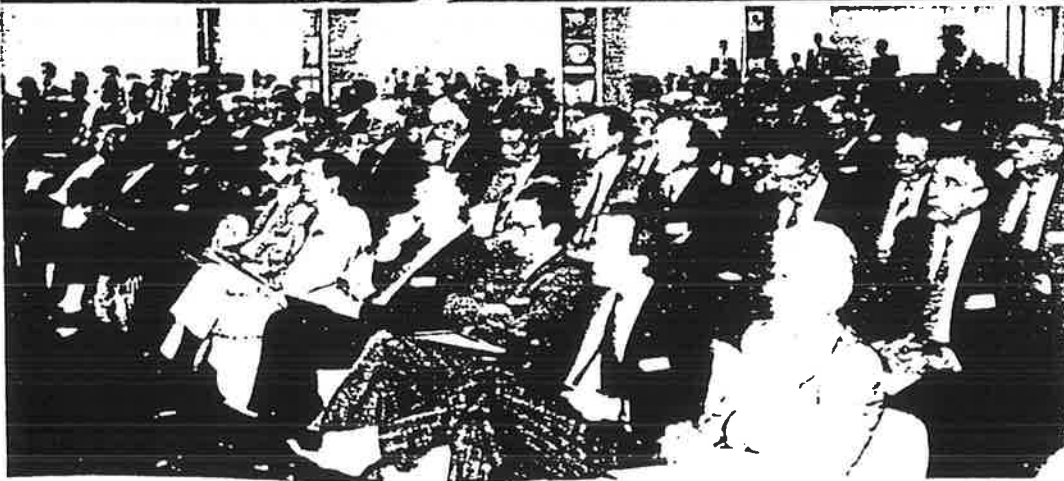
Il tavolo della presidenza dell'assemblea distrettuale di Cittadella ed un aspetto della sala dell'Hotel Palace con i duecento rotariani presenti